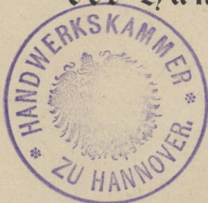
Siegel der Handwerkskammer.

Der Gehilfen-Prüfungsausschuss der Handwerkskammer zu Hannover.