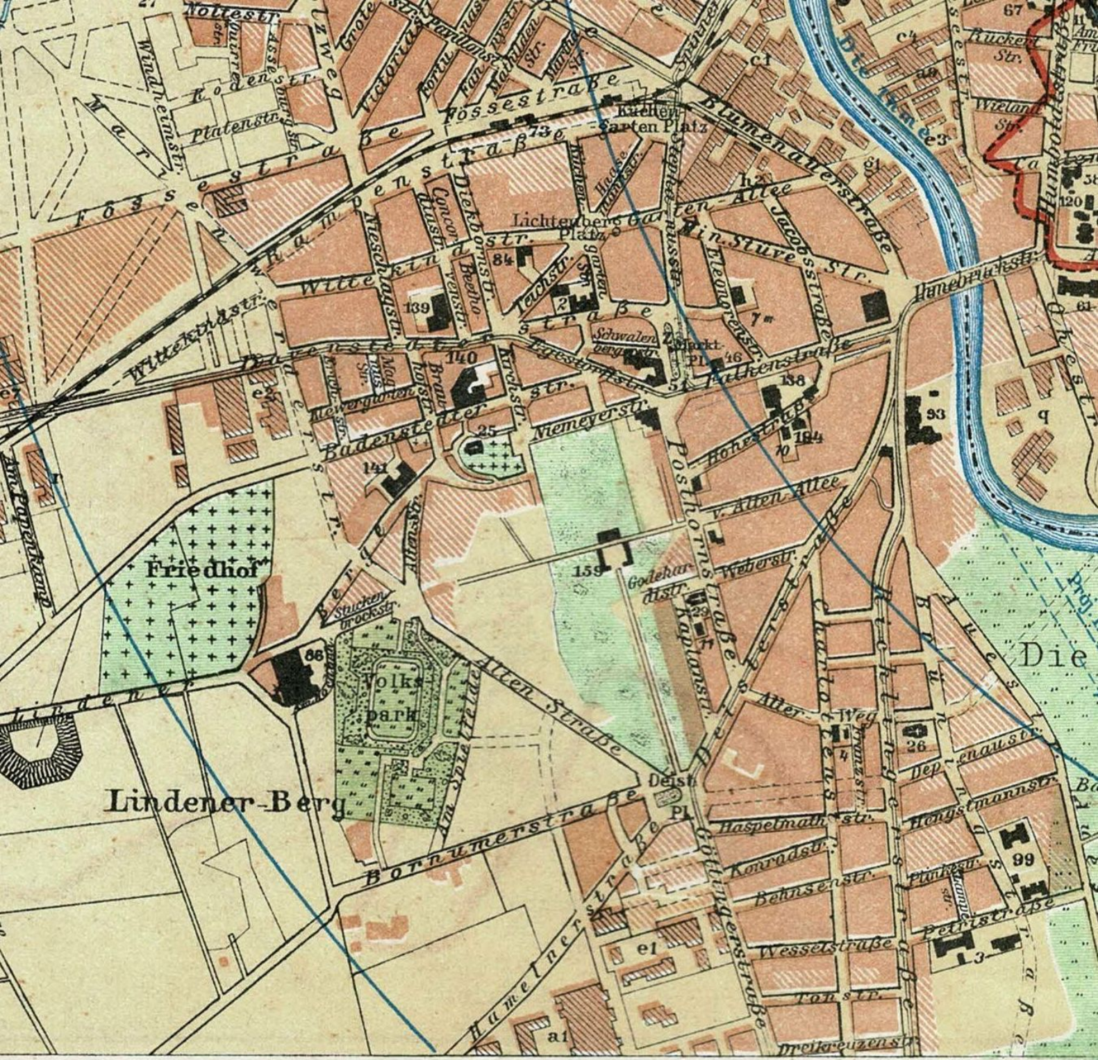
Maßstab 1:15 000 (1 mm der Karte = 15 m der natürlichen Länge)