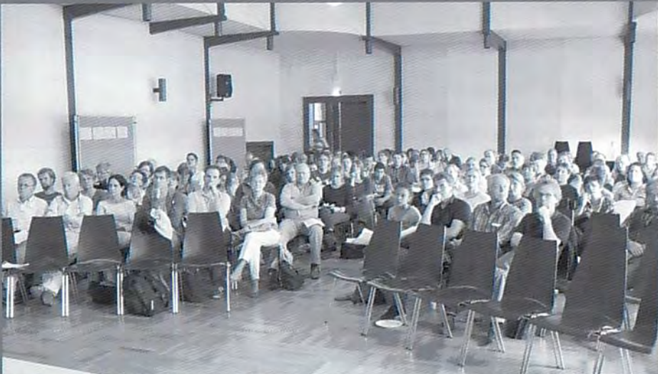
Gesamtkonferenz Mai 2011