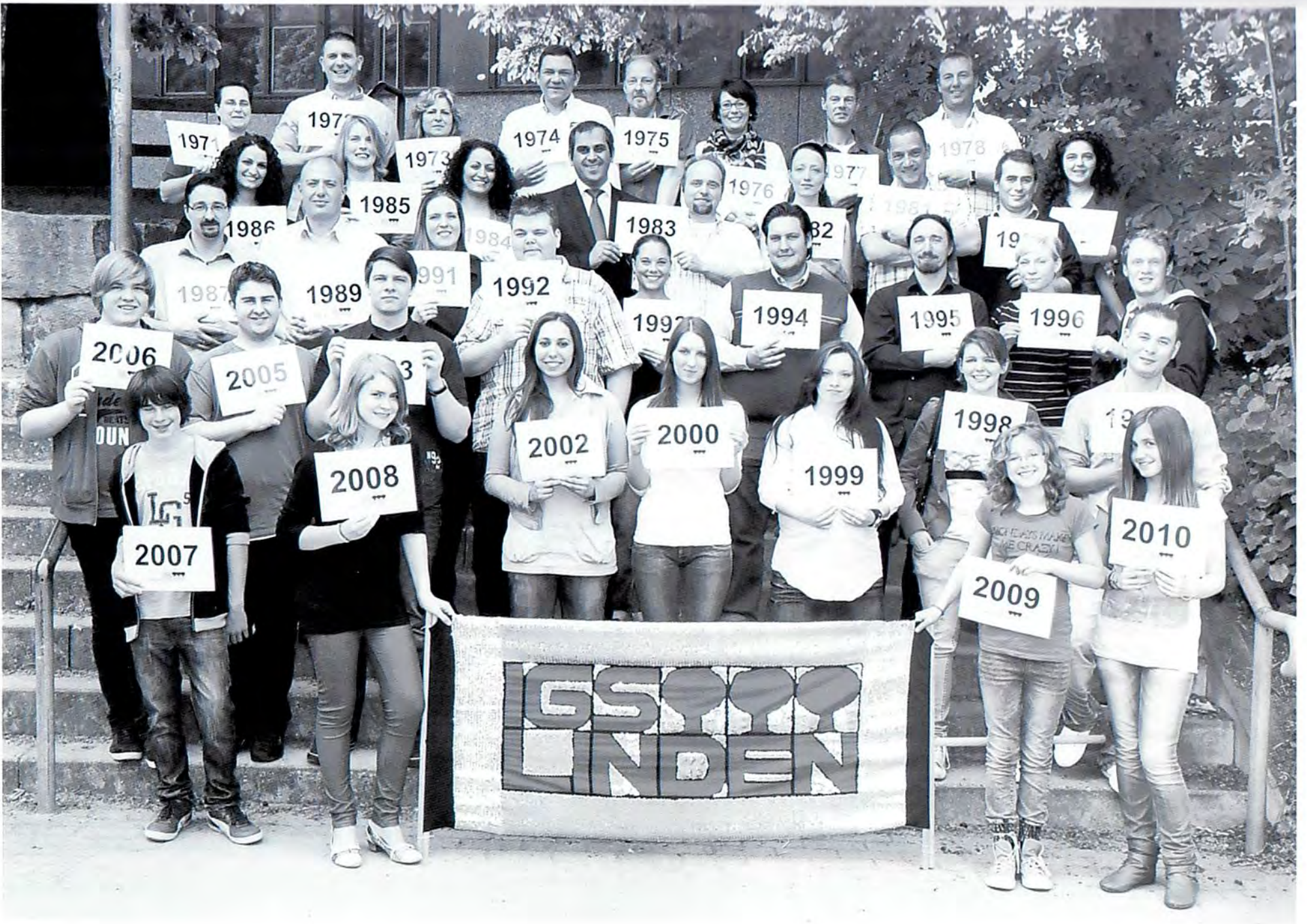
2011 – 40 Jahre Jubiläum