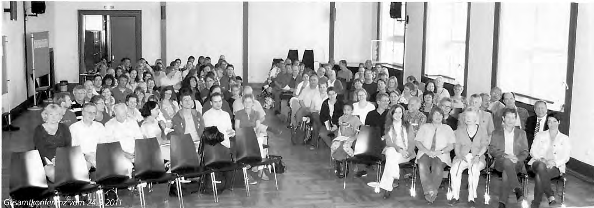
Gesamtkonferenz vom 24.3.2011