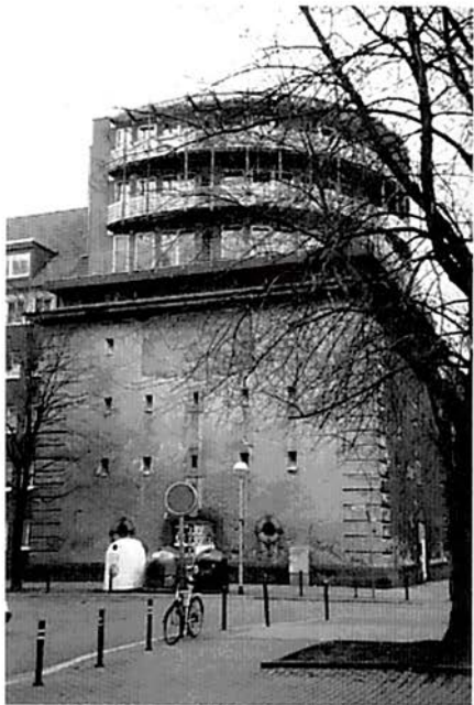
Bunker am Pfarrlandplatz heute